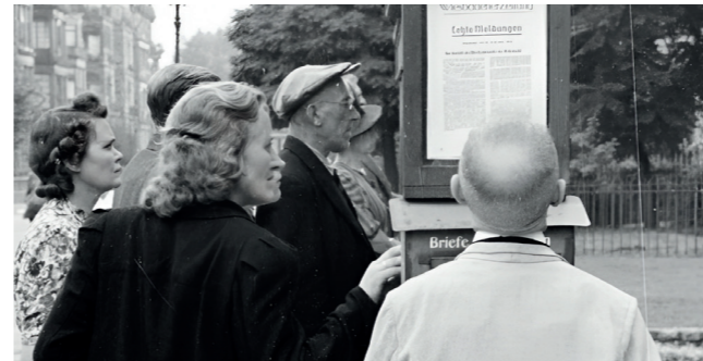
Wiesbadener Zeitung, 1943-09-10 bis 1943-09-20, Bahnhofstraße 33 (Ausschnitt)

Am 28. März 2025, genau 80 Jahre nach der Befreiung Wiesbadens durch amerikanische Truppen, wird das Jahr 1945 durch das virtuelle Blättern in digitalisierten Zeitungsausgaben neu beleuchtet. Die Hochschul- und Landesbibliothek RheinMain bietet mit ihrem online zugänglichen und im Volltext durchsuchbaren Zeitungsarchiv die einmalige Möglichkeit, in das Leben einer dramatischen Umbruchszeit einzutauchen – vom Ende der NS-Herrschaft bis zu den ersten Schritten in Richtung Demokratie. Die Zeitungen dokumentieren nicht nur die Unsicherheit und Hoffnung jener Monate, sondern auch den Alltag einer außergewöhnlichen Zeit.