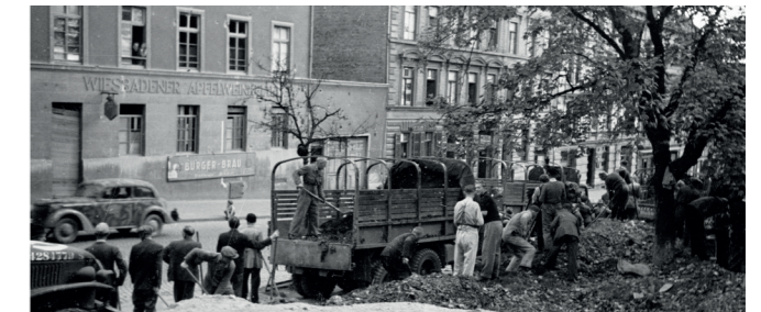
Aufräumarbeiten in der Hellmundstraße, 1945